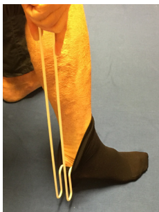
5. När krokens yttersta del nått fotsulan förs kroken bakåt över hälen. Skaftet vinklas ut från benet samtidigt som kroken trycks nedåt så att strumpan kan lyftas nedom hälen.