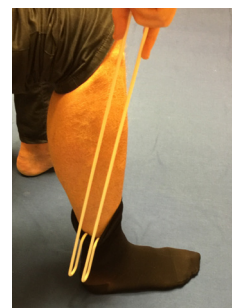
4. Avtagaren förs ned bakom yttre fotknölen.