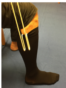
2. Kroken sticks ned innanför strumpkanten.