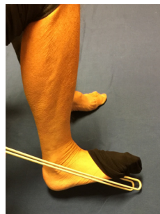
6. Avtagaren förs framåt och strumpan lyfts av foten.