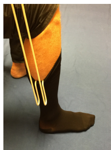
3. Avtagaren trycks nedåt.